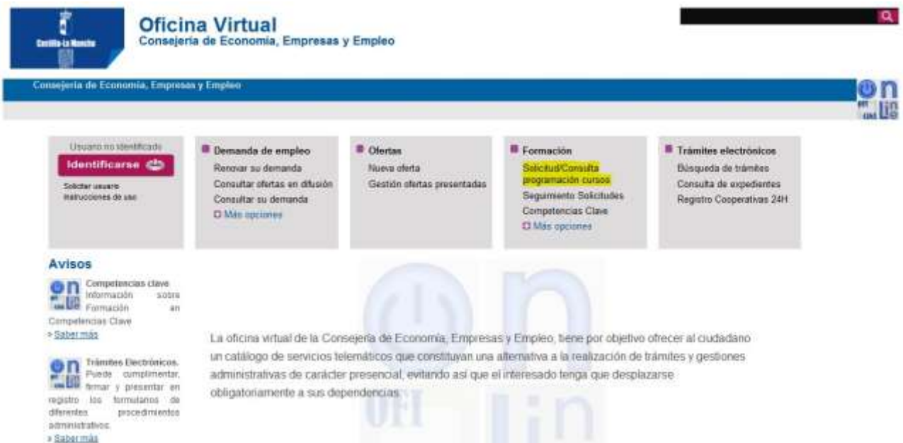
Figura 1: Búsqueda de cursos

Aparecerá la siguiente pantalla. Hay que pulsar en Formación: Solicitud/Consulta programación cursos, como se muestra en la Figura 1: